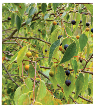
- Micocoulier -