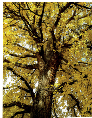
- Ginkgo -