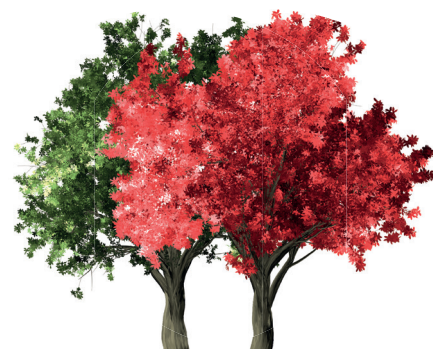
- Zelkova -