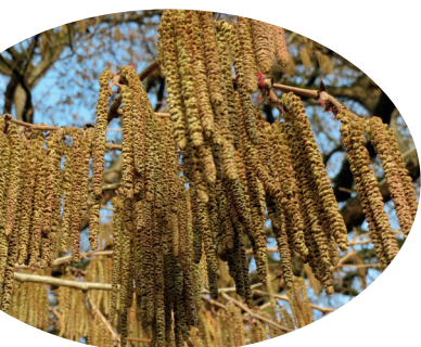
- Noisetier de Byzance -

➤➤ Ainsi, pour chaque arbre coupé sur la commune, un autre est replanté !