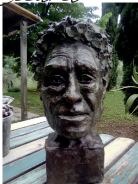
Artiste peintre & sculptrice